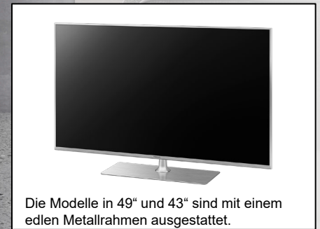
Die Modelle in 49" und 43" sind mit einem edlen Metallrahmen ausgestattet.